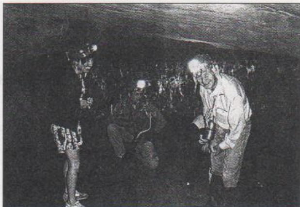
L'ancienne carrière aujourd'hui champignonnière est mal connue des spéléologues

Néanmoins, après quelques heures de « mélodie en sous-sol » et pour peu que l'on soit claustrophobe, on apprécie de « refaire surface » : il y fait plus chaud et l'on préfère que ce soit le ciel qui nous tombe sur la tête !