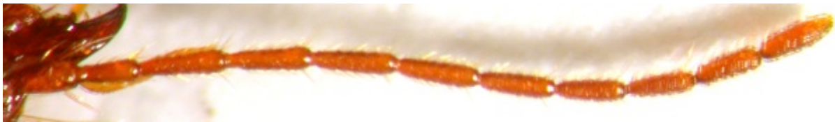
Figure 6 : Duvalius magdelainei tordjmani n. ssp., antenne droite.