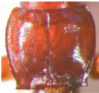
Figure 2 : Duvalius magdelainei magdelainei , de Beuil, pronotum.