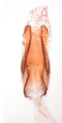
Figure 9 : Duvalius magdelainei tordjmani n. ssp., pièce copulatrice.