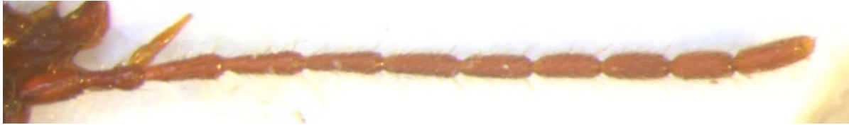
Figure 5 : Duvalius magdelainei alticola , de Roubion, antenne droite.