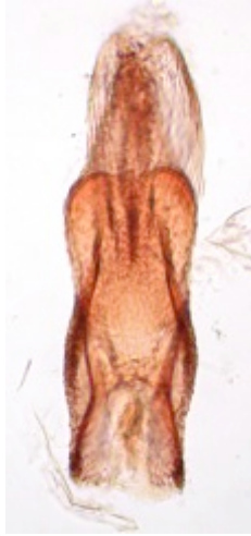
Figure 8 : Duvalius magdelainei alticola , de Roubion, pièce copulatrice.