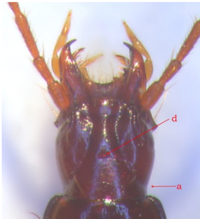
Figure 7 : Duvalius magdelainei tordjmani n. ssp., tête.