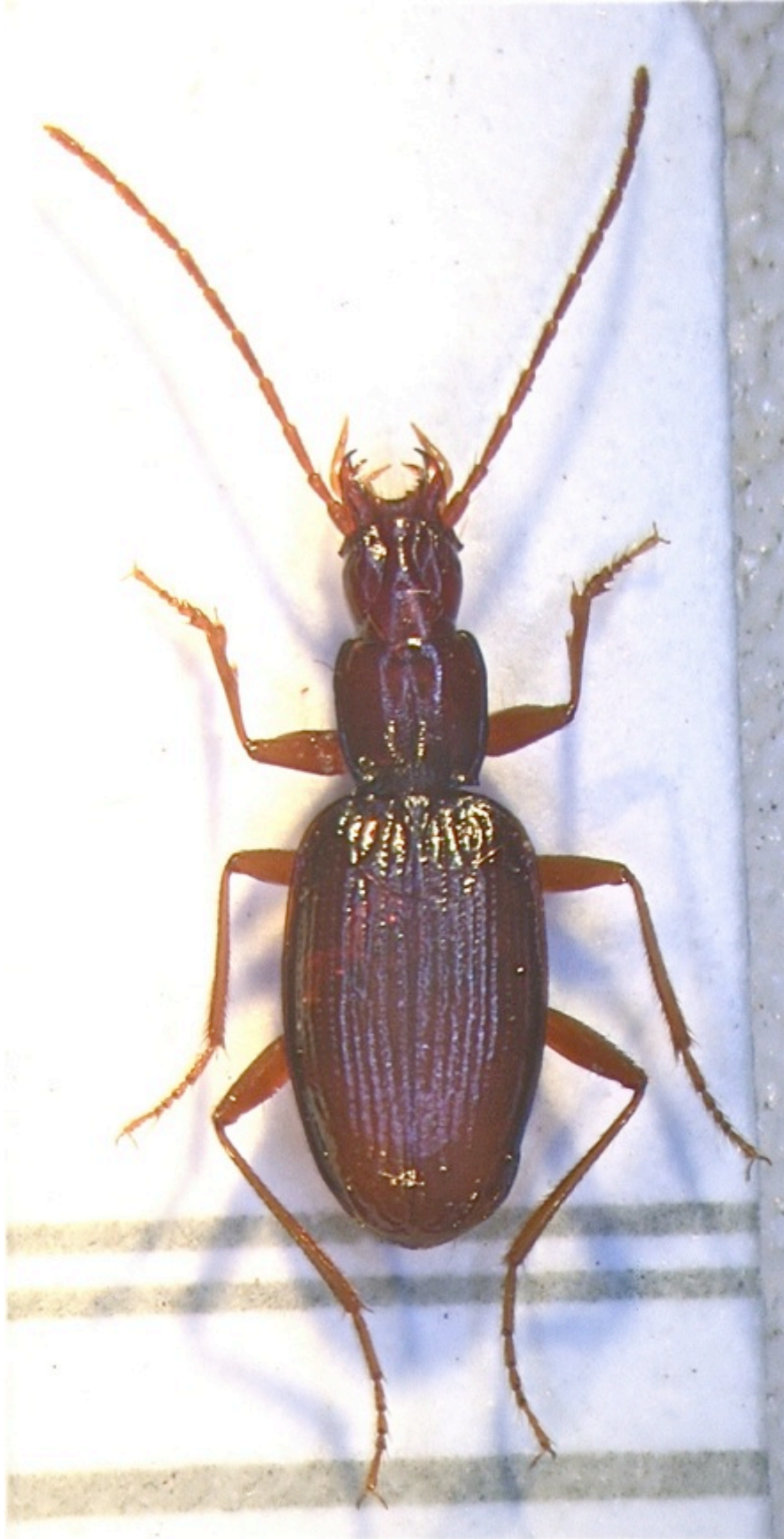
Figure 1 : Duvalius magdelainei tordjmani n. ssp., holotype (♂).