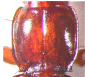
Figure 4 : Duvalius magdelainei tordjmani nov., pronotum.