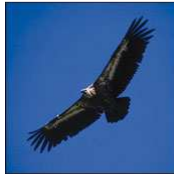
vautour fauve - Gyps fulvus

C'est l'un des plus grands rapaces de France, son envergure varie de 2,35 m à 2,65 m pour un poids de 7 à 11 kg. Il est caractérisé par ses couleurs brune et crème, sa tête fine au front plat et son long cou, garni d'un duvet blanc et ras, qui émerge d'une collerette de plumes blanches duveteuses.