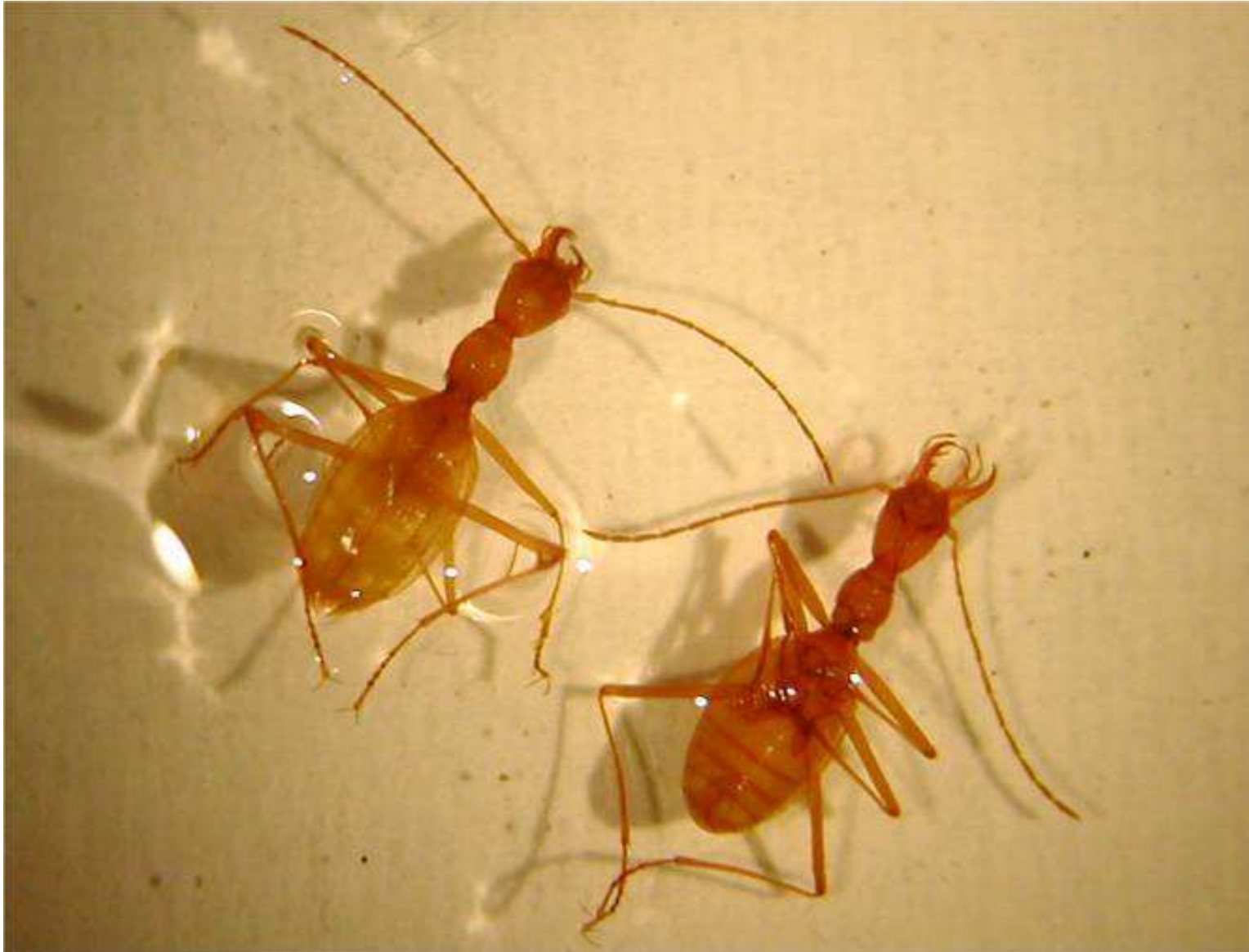
Aphaenops trouvés à -1000 dans le Gouffre des Partages