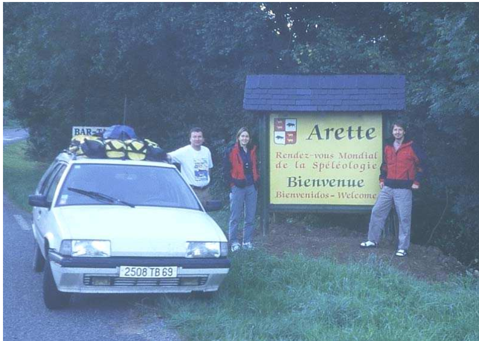
Arette, capitale mondiale de la spéléologie ?

médecin lui diagnostiquera une rupture du pot d'échappement.