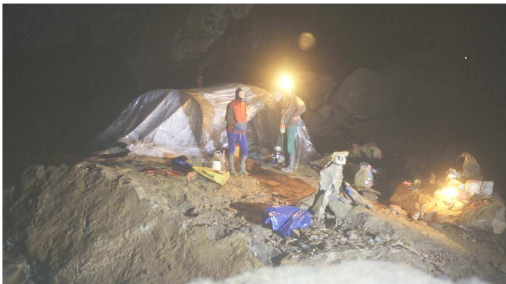
Le bivouac dans la Salle de l'Eclipse Songe d'une nuit d'été