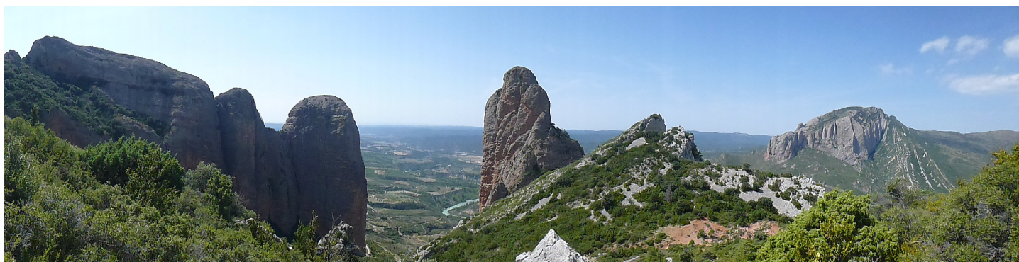
Les Mallos de Riglos – Huesca – Aragon