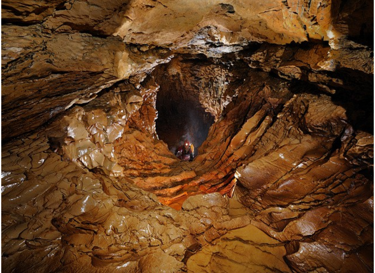
Grotte Perret - Chartreuse, clichés : Christophe Tschertter, Cueva Canuela, Cantabriques,