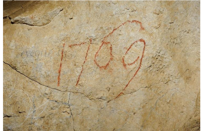
La plus ancienne date relevée au Glaz, cliché : Ch. Tschertter.

Descente au trou du Glaz, pour une petite séance photos de signatures dans la galerie d'entrée, arrêt à la faille remontante, dans cette zone, il y a très peu de signatures à la calligraphie soignée !