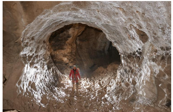
Merveilleuse – Vertige, cliché : Alex Pont.