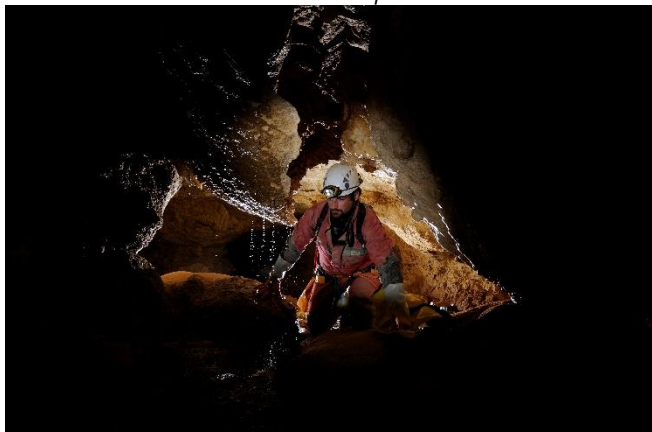
Grotte de Bury, cliché : Ch. Tschertter.

Guy Decreuse a posté des photos sur sa page Flickr https://www.flickr.com/photos/73270743@N02/19670580830/in/atoposted/ https://www.flickr.com/photos/73270743@N02/19670533838/in/potostream/