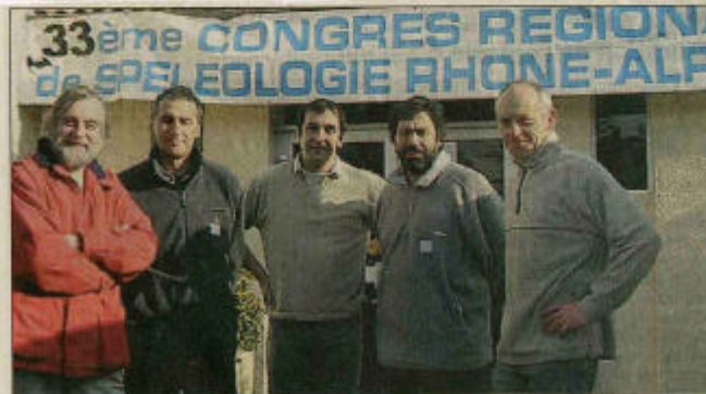
Le Progrès de l'Ain du lundi 7 mars 2005 - Communiqué par Bernard Abdilla.

parmi lesquels des spéléos, des enseignants, des chercheurs, des gestionnaires de l'environnement karstique, partagent la même motivation. A défaut de sites propres à leur passion, les participants à ce congrès ont découvert un village accueillant et un cadre favorable à une journée de travail intense tournée vers le futur.