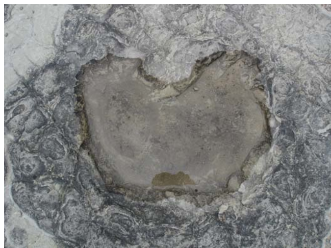
Taille : 50 cm environ – cliché : JPG.

Extrait du Journal du CNRS - N° 209 - Juin 2007