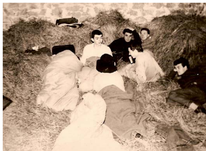
1961 dans la grange à Torcieu - Ain