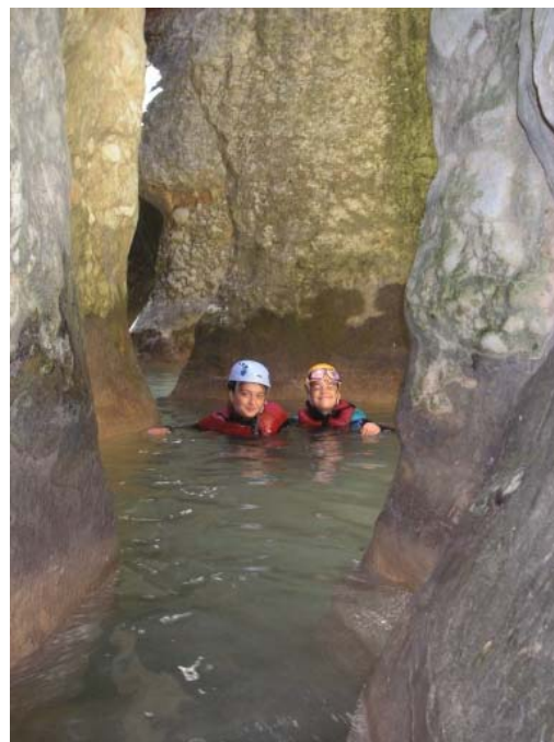
Estrechos del Gorgonchon