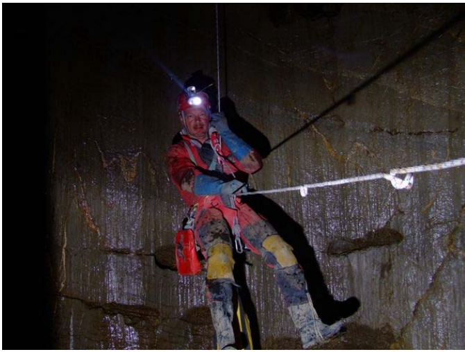
Trou ses Suisses – cliché : David Cantalupi.