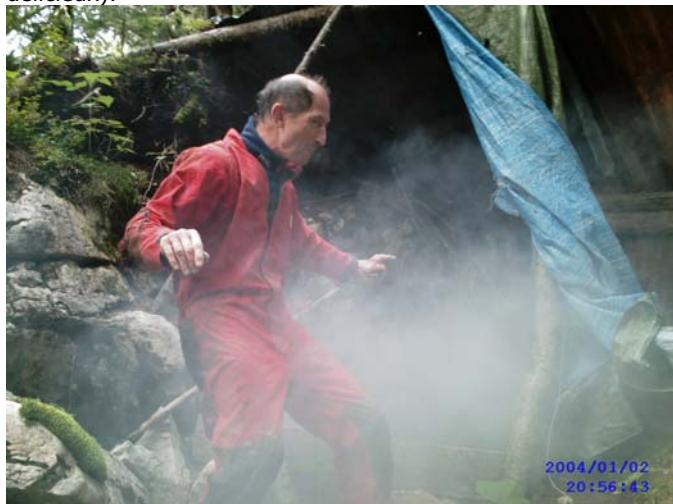
Brouillard ou autres substances ?

Descente vers 18h et apéro aux lactaires grillés (lactaires délicieux).